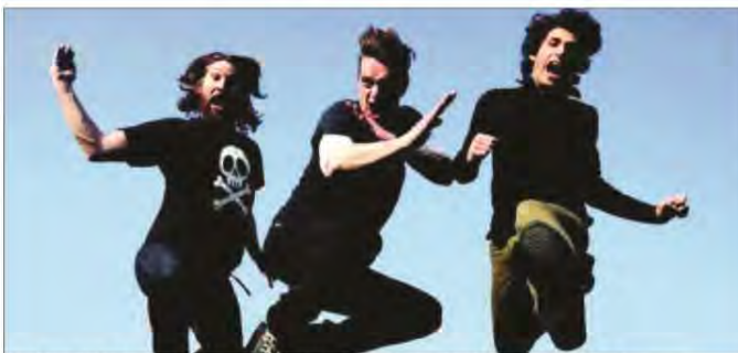
The New Kids passe deux jours en résidence à Cognac pour son nouveau spectacle.

changer par rapport à nos autres groupes. On adapte tout de même le volume sonore. On s'autorise aussi des choses que l'on s'interdit autrement, parce que cela a été fait mille fois. C'est comme un synthèse du rock qu'on leur présente. Et les textes sont adaptés pour ne pas qu'ils s'ennuient. Il y a une chanson en an-