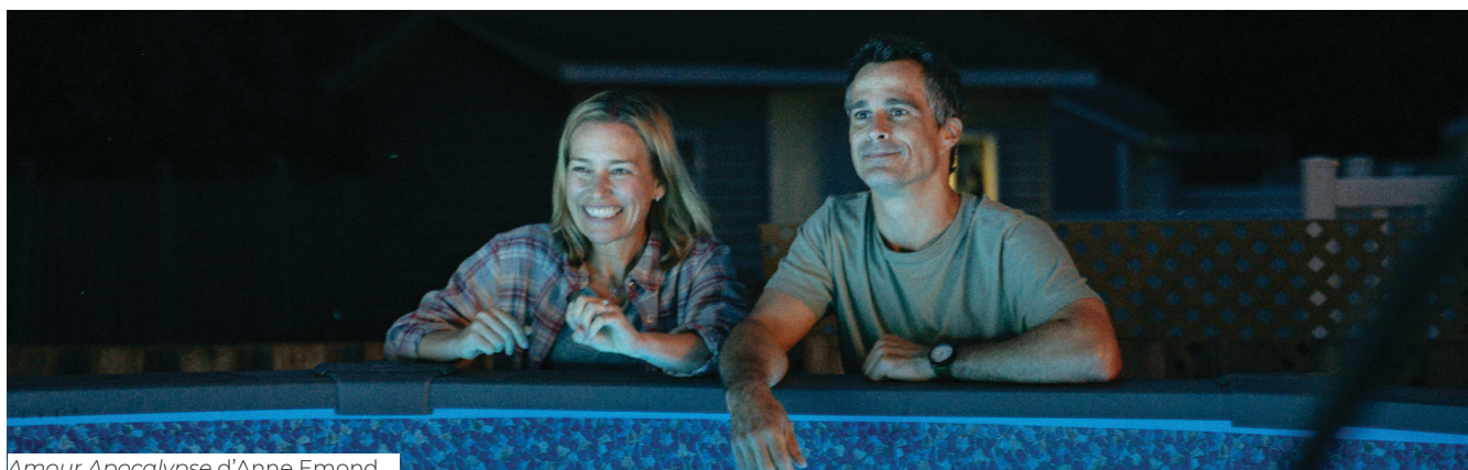
Amour Apocalypse d'Anne Emond